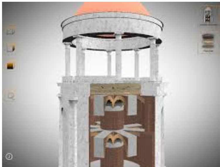
3. Vue intérieure du sous-bassement de la salle à manger

Les invités de Néron pouvaient donc manger tout en observant la magnifique vue panoramique et, la nuit, regarder par l'oculus tourner les étoiles.